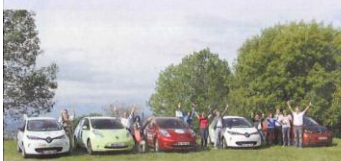
PETITE PAUSE À CHÂTEAU-CHINON POUR LA CARAVANE DES VÉHICULES ÉLECTRIQUES.